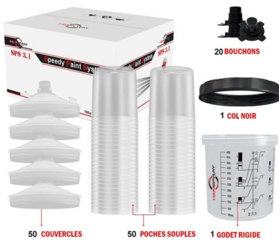
PACK DE 50 PIECES